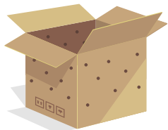
Dunkle Transportbox aus Karton mit Luftlöchern