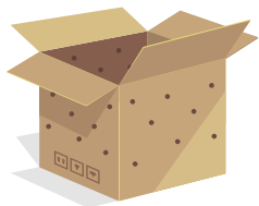
Boîte de transport foncée en carton avec des trous d'aération.