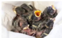
Oisillon sans plumage

Si vous n'êtes pas sûr, appelez le centre de soins : (+352) 26 51 39 90